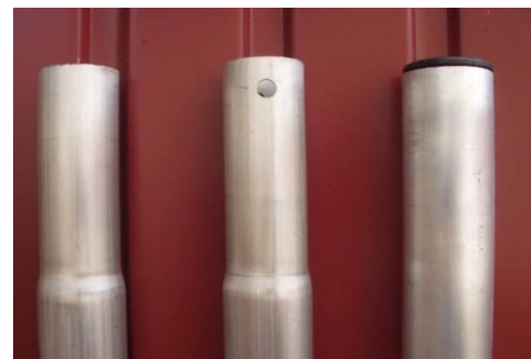
Комплект поставки МТ-5